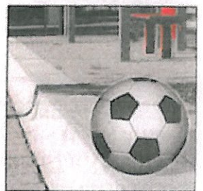
Weltmeisterlich: Der Bordstein, hier mit einem Fußball.

• die Höhe und die Nähe zum Bus lässt Kunden leichter einsteigen und er ist einfach zu verlegen. (ddd)